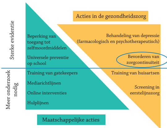
Figuur 1 – Mate van bewijskracht voor verschillende preventiestrategieën (gebaseerd op Zalsman et al., 2016)