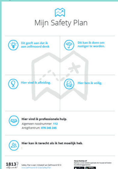
Figuur 4: Safetyplan (Aerts et al., 2017)

Een safety plan zorgt ervoor dat de suïcidale persoon voorbereid is op een mogelijke suïcidale crisis (Stanley & Brown, 2012; Stanley et al., 2018). Een sjabloon safety plan is te downloaden via www.zelfmoord1813.be/safetyplan .