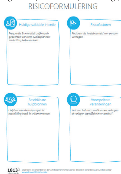
Figuur 3: Sjabloon risicoformulering (Aerts et al., 2017)

In de toekomst zou het nuttig zijn mocht dergelijke risicoformulering kunnen ingebed worden in bestaande eHealth toepassingen . Dit kan de kwaliteit van zorg versterken en biedt ook veel mogelijkheden voor onderzoek naar risico-inschatting (Simon et al., 2018).